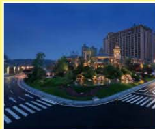
成都雅居樂豪生大酒店 Howard Johnson Agile Plaza Chengdu