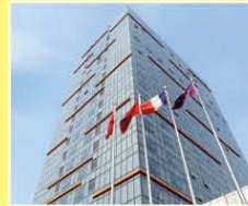
濟南陽光壹佰美爵酒店 Grand Mercure Jinan Sunshine