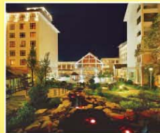
張家界京武鉅爾曼酒店 Zhangjiajie Pullman Hotel