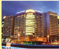
蘇州威聯豪生酒店 Howard Johnson Wuzhong Business Club Hotel Suzhou