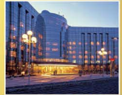
西安香格里拉金花酒店 Shangri-La Golden Flower Hotel Xi'an