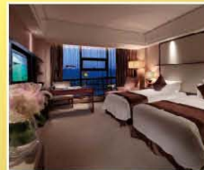
張家界皇冠假日酒店 Crowne Plaza Zhangjiajie