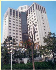
上海寶隆美爵酒店 Grand Mercure Baolong Hotel Shanghai