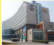
青島逸林希爾頓酒店 DoubleTree By Hilton Qingdao