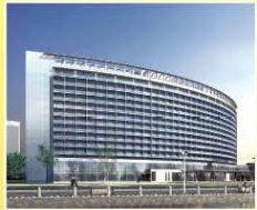
南京世茂濱江希爾頓酒店 Hilton Nanjing Riverside Hotel