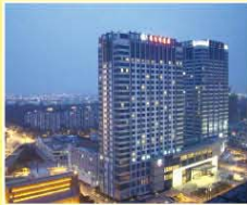
無錫逸林希爾頓酒店 DoubleTree by Hilton Wuxi