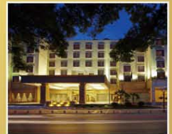
桂林喜來登酒店 Sheraton Gullin Hotel