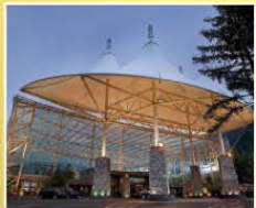
九寨溝天堂洲際酒店 Intercontinental Hotels & Resort Jiuzhaigou