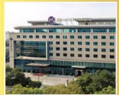
北京東方美爵酒店 Grand Mercure Beijing Dongcheng