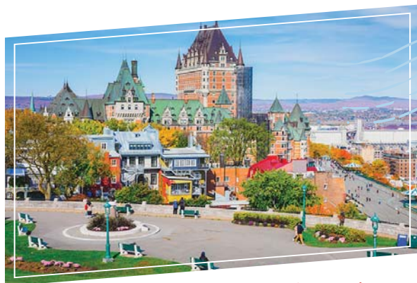
魁北克市 Quebec City

素有“北美小巴黎”之稱，融合歐洲傳統與北美現代城市的風貌；世界第二大法語城市，洋溢歐陸風情，盡顯加國第二大都市的繁華與精彩。