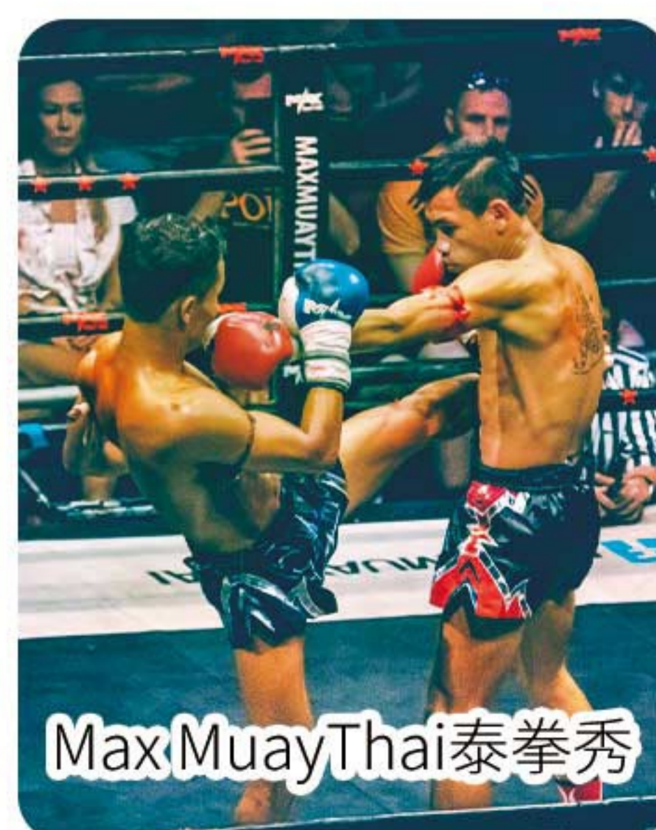
Max Muay Thai泰拳秀